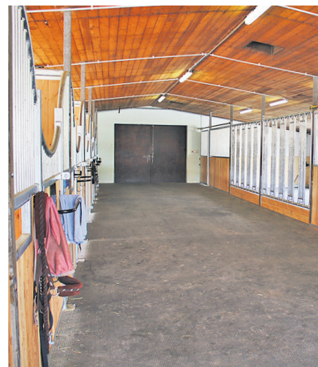
Der neue Stall präsentiert sich hell und freundlich.