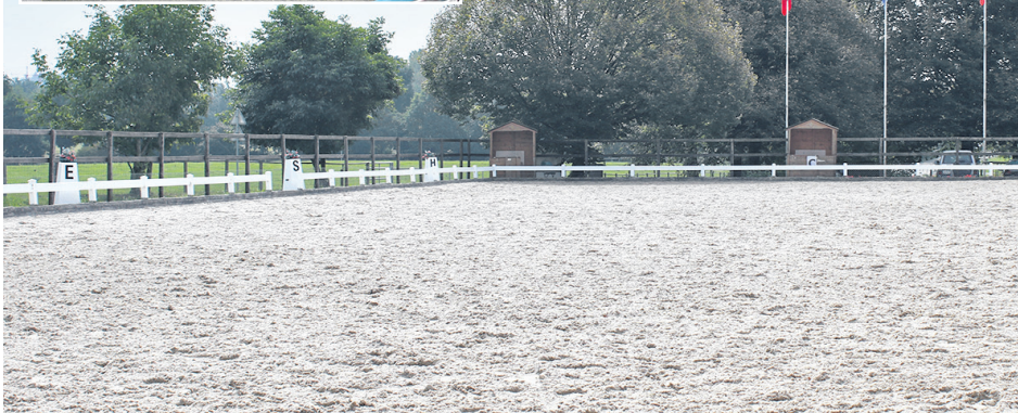
Das grosse Aussenviereck mit den Parademassen 20 mal 60 Meter und die Reithalle mit angrenzender Tribüne und Reiterstübli.