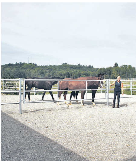
Der allwettertaugliche Fohlenauslauf ermöglicht jederzeit den Auslauf im Freien.